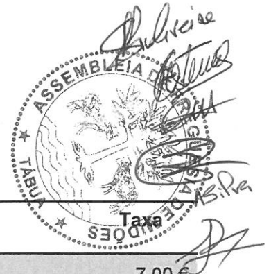
TABELA IV Outras Taxas