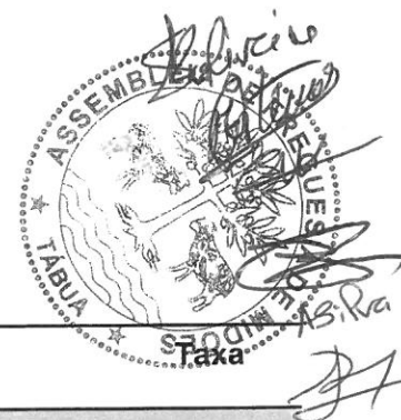
TABELA III Cemitério